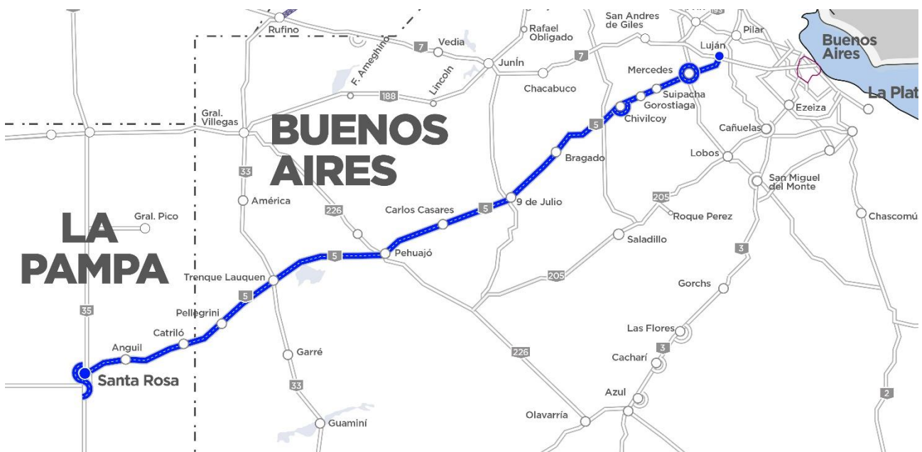
Imagen 1 – Tramo X de Corredores Viales

La obra se ubica en la Ruta Nacional N° 5, sobre la extensión concesionada, desde Km. 68,00 hasta Km. 606,70 integrante del Tramo X de la red de Corredores Viales concesionados por Vialidad Nacional, en las Provincias de Buenos Aires y La Pampa. Esta Ruta cuenta con un tránsito medio diario anual de 3977 vehículos promedio en toda su extensión, teniendo zonas de más 11000 vehículos promedios por día.