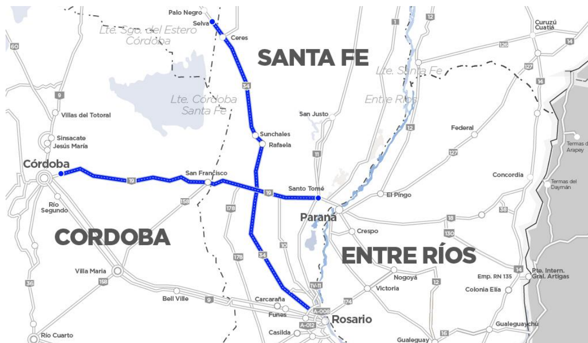
Imagen 1 – Tramo V de Corredores Viales

La obra se ubica en la Ruta Nacional N° 34 desde Km. 20,50 hasta Km. 22,10 (Localidad de Luis Palacios), sobre la extensión concesionada integrante del Tramo V de la red de Corredores Viales concesionados por Vialidad Nacional, en la Provincia de Santa Fe.