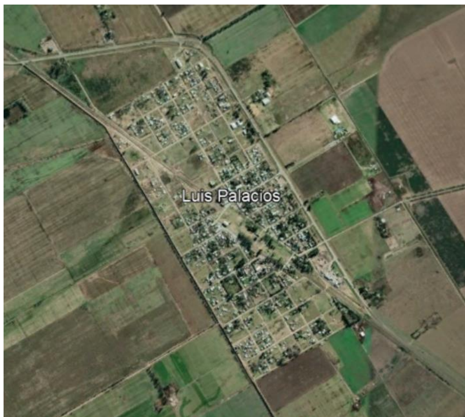
Imagen 2 – Localidad de Luis Palacios