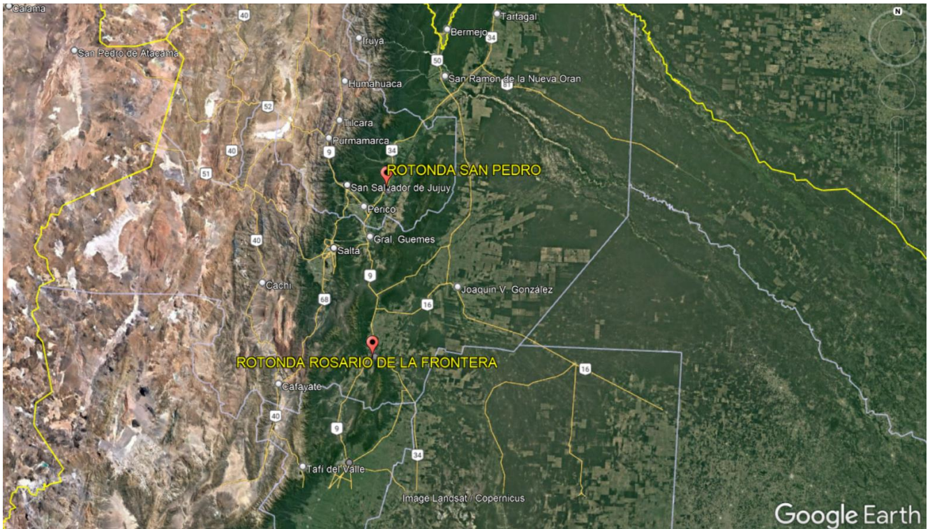
Imagen 2 – Imagen satelital de ubicación de las rotondas