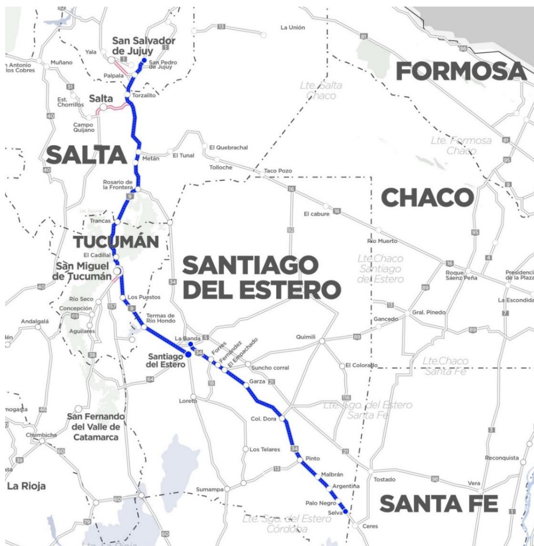
Imagen 1 – Tramo I de Corredores Viales

Una de las obras se ubica en la RN N°9 km 1423.17, Rotonda de Acceso a la localidad de Rosario de la Frontera provincia de Salta y la otra en la RN N°34 km 1196.35, Rotonda de Acceso a la localidad de San Pedro provincia de Jujuy correspondientes al Tramo I de la red de Corredores Viales concesionados por Vialidad Nacional, en las Provincias de Santiago del Estero, Tucumán, Salta y Jujuy.